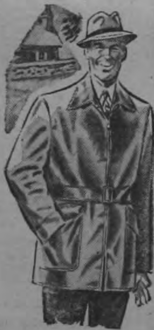
JACKETS CAMPEON Estilos originales apropiados para la época. Moldes Red-Art (únicos) im- portados para todos los tipos de jackets.