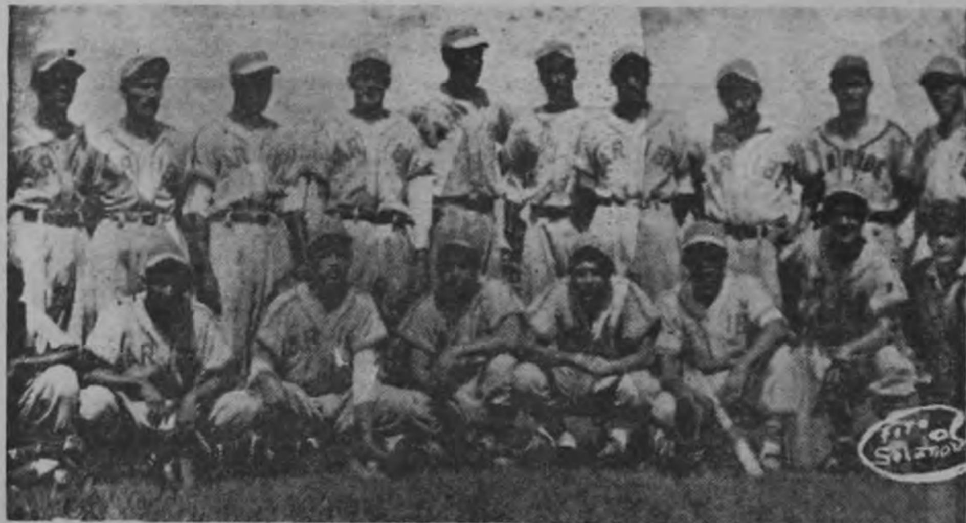
CARIBE B. B. C. Tócales vérselas frente al "NUMAR". La afición espera un choque de titanes.

Por el Campeonato Mayor Jofino de Beisbol, hoy en la tarde en el Parque Escarré, se medirán Numar y Caribe, partido que se espera muy interesante, pues los caribeños con su novena ahora muy fortalecida con elementos de grandes capacidades, están dispuestos a dar todo de sí en procura del triunfo, ante un oponente que hasta la fecha no ha perdido ningún encuentro, lo que por sí solo da a entender de su poderío.