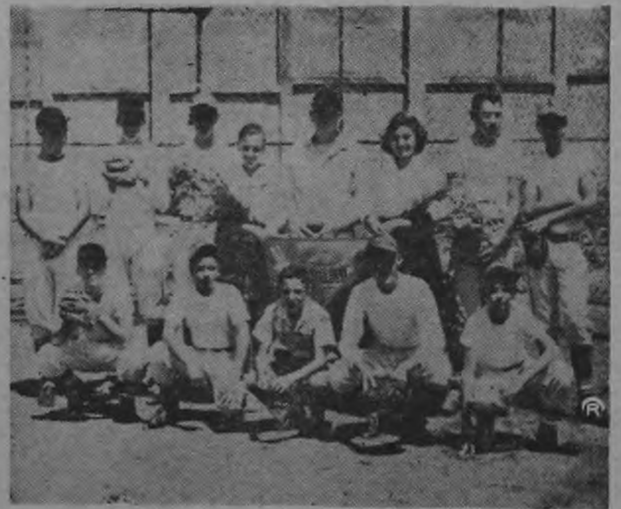
SPOLDING B. B. C., dispuestos a ganar mañana.