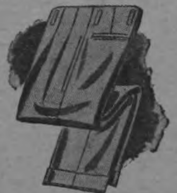
PANTALONES TIPO HD En Dracón - En Gabardina - En Army - Mezclilla y telas tropicales.