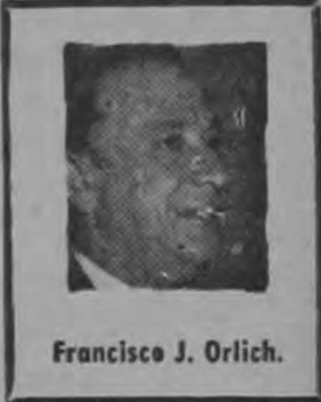
Francisco J. Orlich.

PRIMERA PUBLICACION: 26 DE MARZO DE 1957