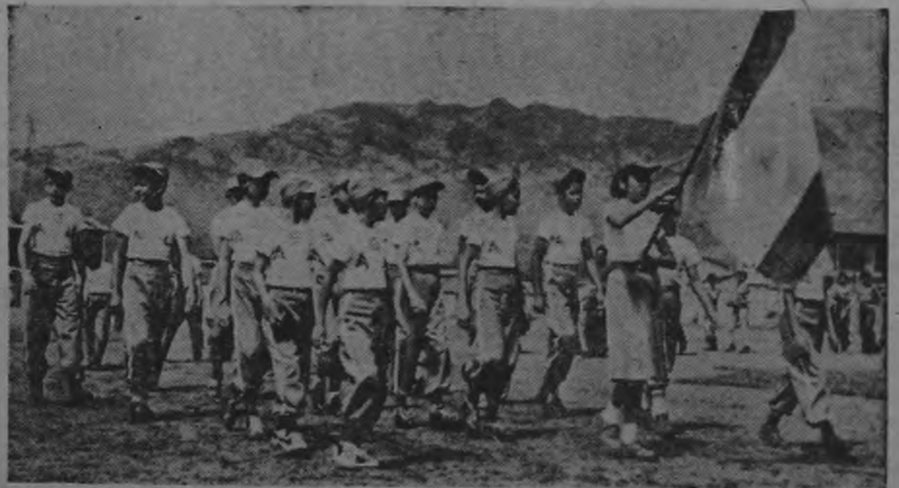
ATLETICO SOTO LOPEZ B. B. C., Duro es el compromiso que les espera el domingo.