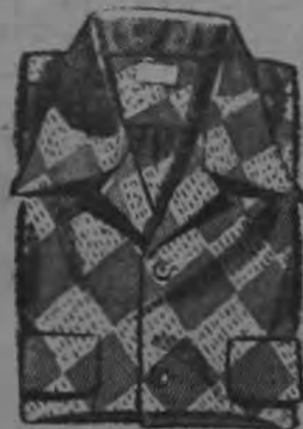
CAMISAS SPORT CAMPEON Las mejores telas totalmente sanfori- zadas Estilos y dibujos modernos.