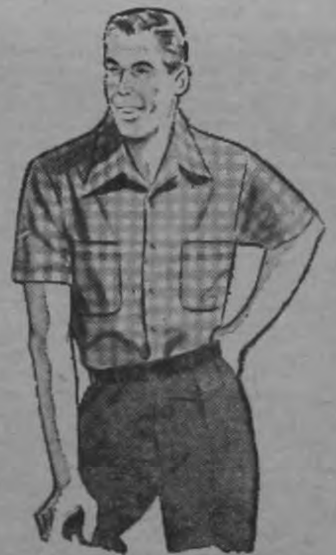
CAMISAS SPORT manga corta.

Vea cuánta novedad le ofrecemos en artículos especialmente indicados para esta fecha.