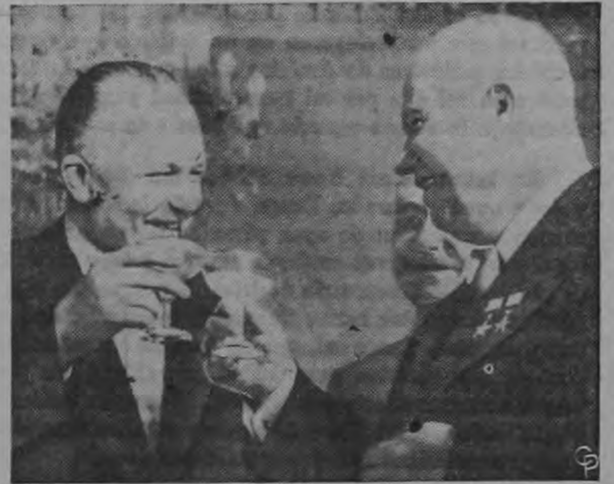
El jefe del partido comunista soviético Nikita Khrushchev (derecha) participa en un brindis con champaña con el primer ministro finlandés V. J. Sukselainen, durante una recepción en Helsinki. El líder soviético pidió una zona de neutralidad báltica con Finlandia como núcleo y advirtió contra los que propician la desconfianza con Rusia. La visita de Khrushchev no ha producido entusiasmo popular en Finlandia.